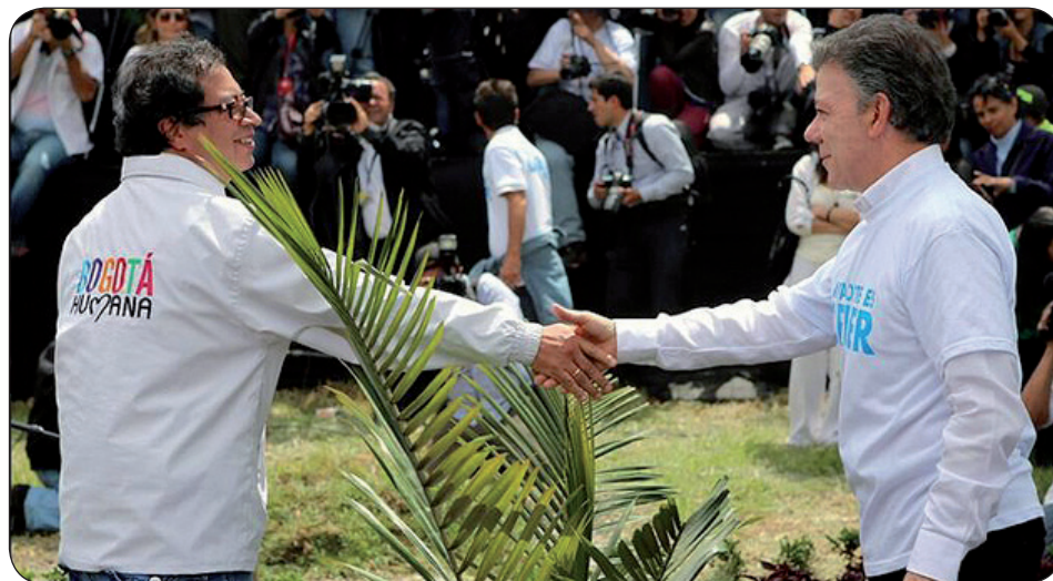
Aspectos, en Bogotá, de la gran marcha en defensa de la paz el 9 de abril, a la cual concurrieron más de un millón de capitalinos. Arriba, Petro y Santos sembrado la Palma de Cera, el árbol nacional, como símbolo de la paz. Abajo, aspecto de la marcha por la Carrera Séptima.