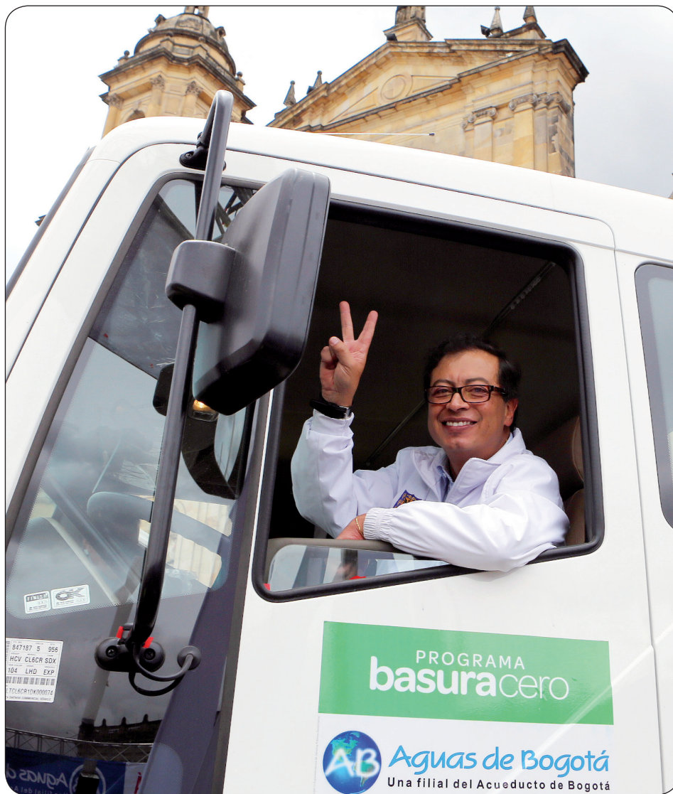
El Alcalde de los bogotanos entregando a la ciudad la nueva flota de recolectores de basura, el pasado mes de abril.

Más que considerarlo como otro logro, la fructífera relación con el Gobierno Nacional ha sido un acierto de Petro, pues beneficia a todas las partes: a los bogotanos, al país, a sus gobernantes y a la institucionalidad. Hasta los momentos de discordia han servido para estrechar una coordinación en objetivos comunes.