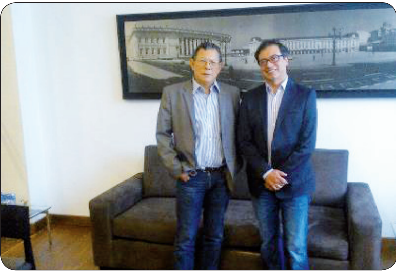
Visita de Marcelo Torres a Gustavo Petro en el Palacio de Liévano. Marzo de 2013.