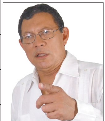
① Sociólogo, cofundador del MOIR y del PTC; alcalde de Magangué luego de derrotar electoralmente a las fuerzas paramilitares "que lo habían convertido en zona de terror y dejado por fuera del estado de derecho."