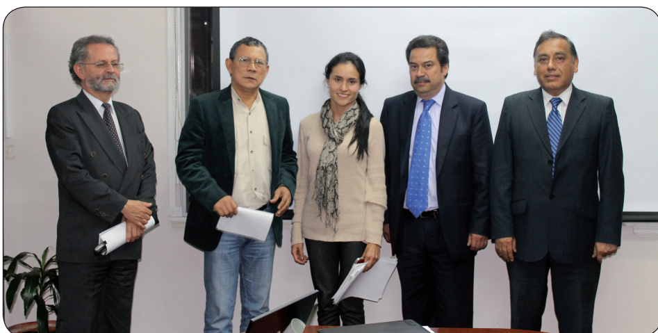
Terminando la renegociación de la deuda heredada del municipio con los bancos. Como garante el Ministerio de Hacienda.