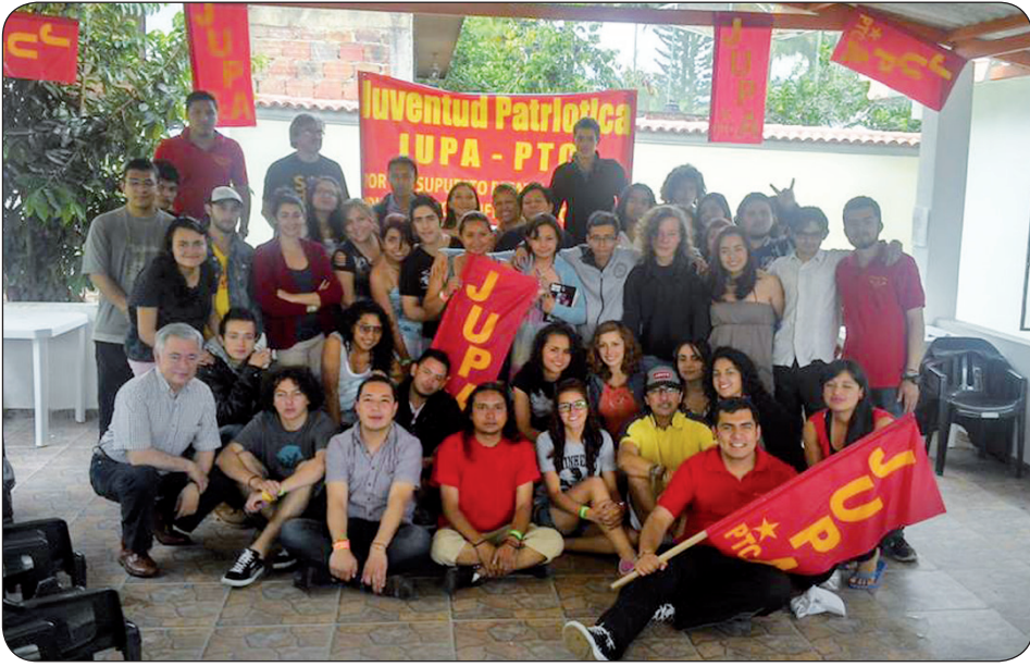
Jóvenes del PTC en el Encuentro de Formación Política organizado por el Comité Ejecutivo Nacional de la Juventud Patriótica, Jupa.