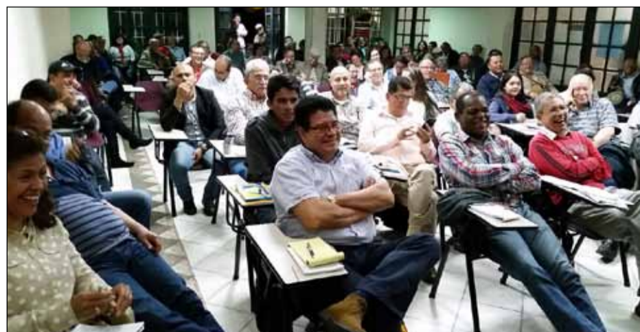
22 regionales asistieron al pleno.

Se invitó a los Regionales del PTC a realizar en el resto de año actividades relacionadas con la vida, obra y legado de Francisco Mosquera. Así mismo, a difundir y reivindicar con conferencias y actos las enseñanzas de Mao Tse Tung en el marco de los 65 años del triunfo de la Revolución China; y a participar en la celebración de los 150 años de la publicación de El Capital de Carlos Marx que se cumplen en 2015. (AH)