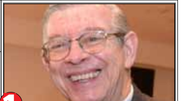
1 Concejal progresista, defensor de la obra de Petro, ingeniero civil vinculado al movimiento obrero desde los años 70, combativo luchador por el trabajo decente.